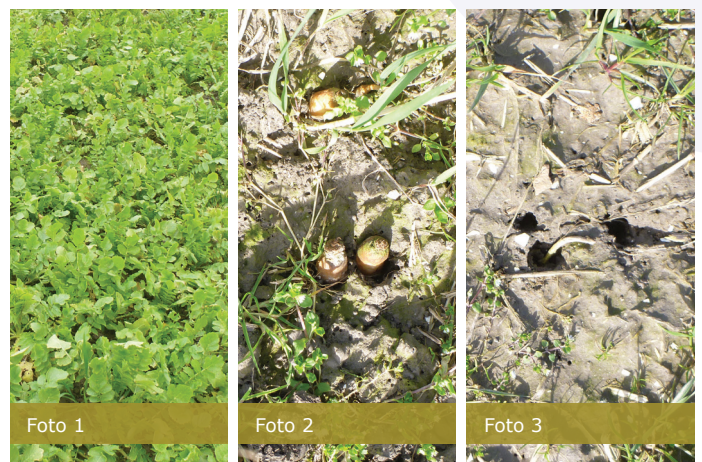
Tillage rammenas in verschillende stadia

In Amerika wordt Tillage rammenas wel ingezet als groenbemester in rijen gezaaid voor mais in Strip-Till. Bij deze vorm van landbouw wordt alleen de bodem in de gewasrij bewerkt. Wanneer in het voorjaar de Tillage rammenas verteerd is, wordt de mais ingezaaid. De bodem in de rij is los door de wortels van de Tillage rammenas en er is direct stikstof beschikbaar voor de mais vanuit de verterende Tillage wortels.